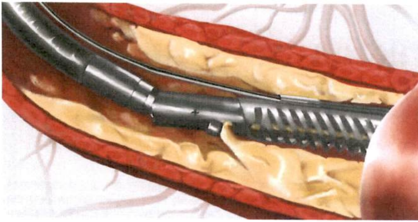
Abb. 1 Mit einem Atherektomie-Katheter wird der Kalk «abgefräst», um das Gefäss optimal auf die Ballonaufdehnung vorzubereiten und das Eindringen des Medikaments in die Gefässwand zu erleichtern.